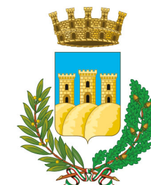
Comune di Ostuni