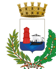
Comune di Martinsicuro