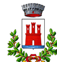
Comune di Valeggio sul Mincio