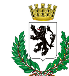
Comune di Vimercate