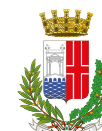
Comune di Rimini