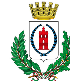
Comune di Gussano