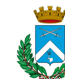
Comune di San Donato Milanese