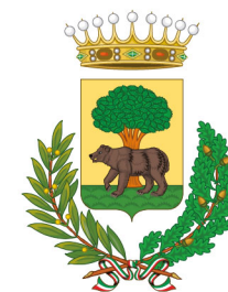
Comune di Biella

Alcuni dei Comuni con cui abbiamo collaborato