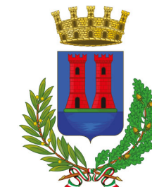
Comune di Desenzano del Garda