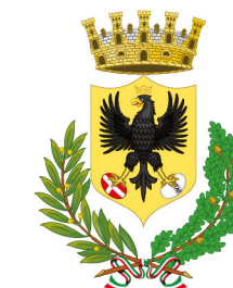
Comune di Forlì