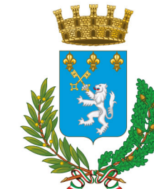
Comune di Lonato del Garda